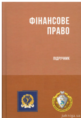
Фінансове право. Підручник