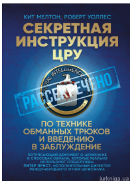
Секретная инструкция ЦРУ по технике обманных трюков и введению в заблуждение