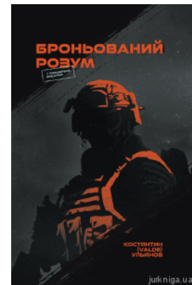
Броньований розум. Бойовий стрес та психологія екстремальних ситуацій