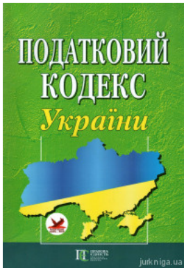
Податковий кодекс України. Алєрта