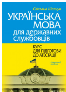
Українська мова для державних службовців: курс для підготовки до атестації