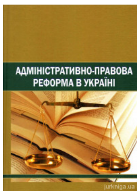
Адміністративно-право ва реформа в Україні