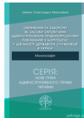
Обмеження та заборони як засоби запобігання адміністративним правопорушенням, пов'язаним з корупцією, у діяльності державних службовців в Україні