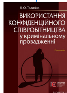
Використання конфіденційного співробітництва у кримінальному провадженні

Перейти до галузі права Кримінальне право та процес