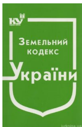
Земельний кодекс України