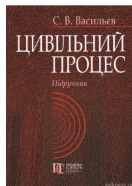
Цивільний процес. Підручник

Перейти до галузі права Кримінальное право и процесс