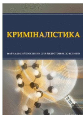
Криміналістика. Навчальний посібник для підготовки до іспитів