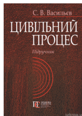
Цивільний процес. Підручник

Перейти до галузі права Кримінальне право та процес