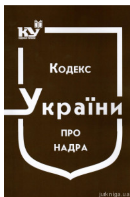
Кодекс України про надра