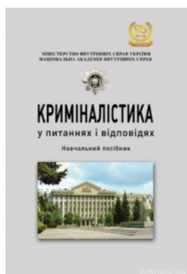
Криміналістика у питаннях і відповідях