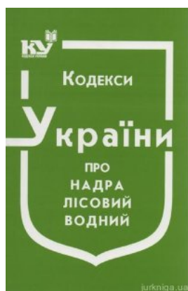
Кодекс України про надра, Лісовий кодекс України, Водний кодекс України