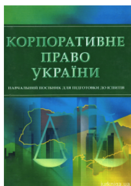
Корпоративне право України. Навчальний посібник для підготовки до іспитів