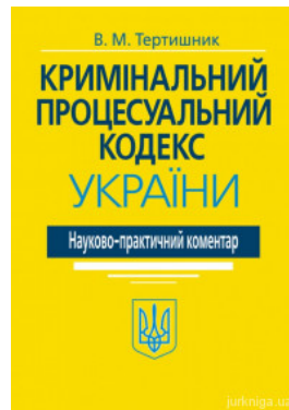
Науково-практичний коментар Кримінального процесуального кодексу України. Видання 20-те