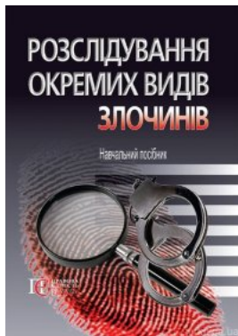
Розслідування окремих видів злочинів. Навчальний посібник