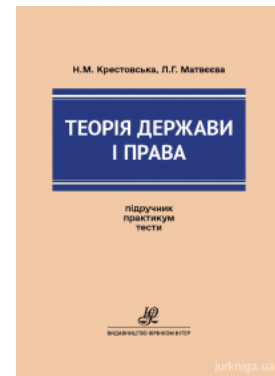
Теорія держави і права. Підручник. Практикум. Тести