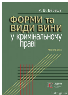
Форми та види вини у кримінальному праві