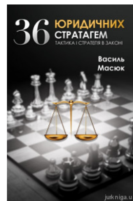
36 юридичних стратегем

Перейти до галузі права Кримінальне право та процес