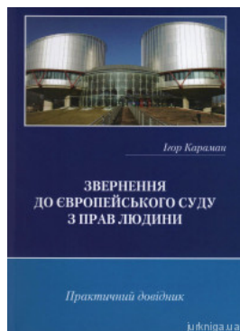
Звернення до Європейського суду з прав людини