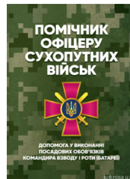
Помічник офіцера Сухопутних військ. Допомога у виконанні посадових обов'язків командира взводу і роти (батареї)