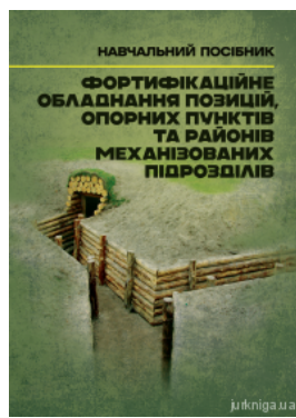
Фортифікаційне обладнання позицій, опорних пунктів та районів механізованих підрозділів