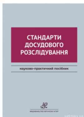
Стандарти досудового розслідування