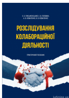
Розслідування колабораційної діяльності