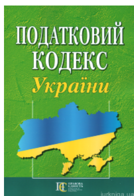
Податковий кодекс України. Алерта