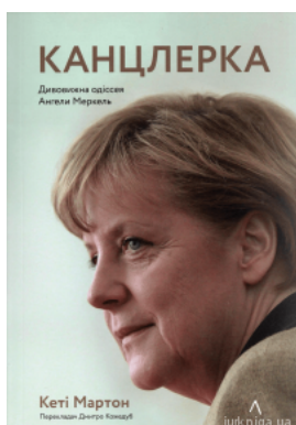
Канцлерка. Дивовижна одісея Ангели Меркель