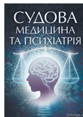
Судова медицина та психіатрія

Перейти до галузі права Кримінальне право та процес