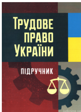
Трудове право України. Підручник