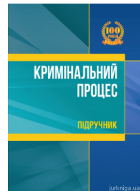
Кримінальний процес: підручник

Перейти до галузі права Кримінальне право та процес