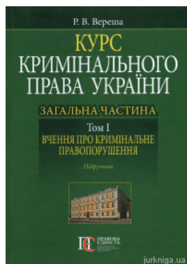
Курс кримінального права України. Загальна частина. Том 1: вчення про кримінальне правопорушення