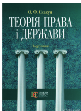
Теорія права і держави. Підручник, 4-те видання