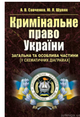
Кримінальне право України. Загальна та Особлива частини (у схематичних діаграмах)