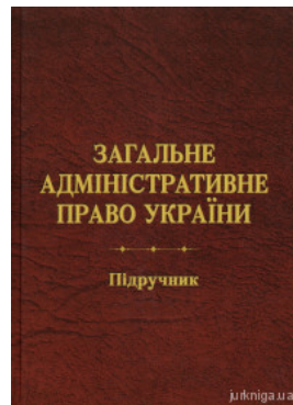
Загальне адміністративне право України