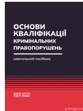
Основи кваліфікації кримінальних правопорушень