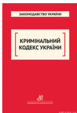
Кримінальний кодекс України. Юрінком Інтер