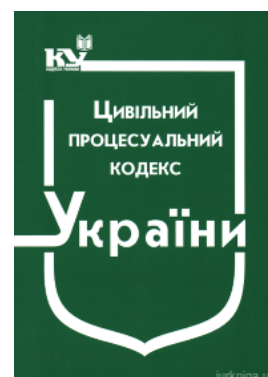
Цивільний процесуальний кодекс України