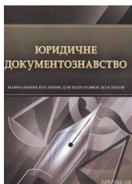
Юридичне документознавство. Навчальний посібник для підготовки до іспитів