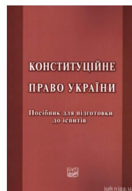
Конституційне право України. Посібник для підготовки до іспитів

Перейти до галузі права Кримінальне право та процес