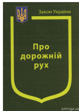
Закон України "Про дорожній рух"