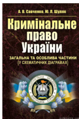
Кримінальне право України. Загальна та Особлива частини (у схематичних діаграмах)