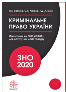
Кримінальне право України. Навчальний посібник для підготовки до ЗНО (ЄФВВ) для вступу на магістратуру

Перейти до галузі права Кримінальне право та процес