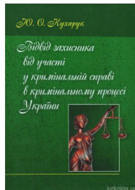
Відвід захисника від участі у кримінальній справі в кримінальному процесі України.