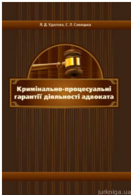
Кримінально-процесуальні гарантії діяльності адвоката. Монографія