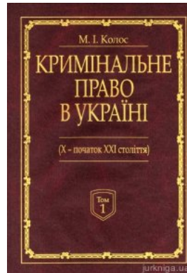
Кримінальне право України (X-початок XXI століття). У 2-х томах