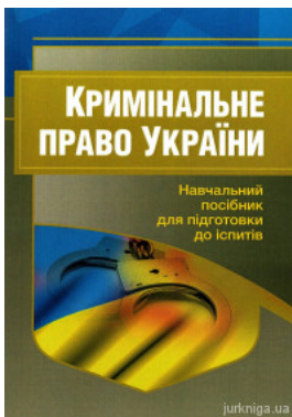
Кримінальне право України. Навчальний посібник для підготовки до іспитів