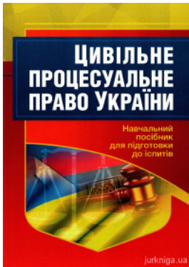
Цивільне процесуальне право України. Навчальний посібник для підготовки до іспитів