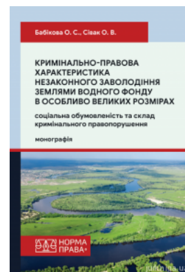
Кримінально-правова характеристика незаконного заволодіння землями водного фонду в особливо великих розмірах: соціальна обумовленість та склад...

Перейти до галузі права Кримінальне право та процес