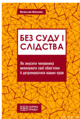
Без суду і слідства