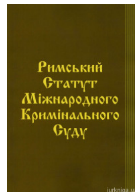
Римський Статут Міжнародного кримінального суду. Паливода