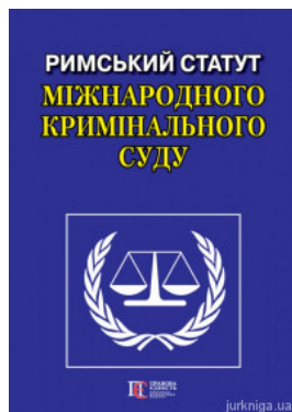
Римський Статут Міжнародного кримінального суду. Алерта