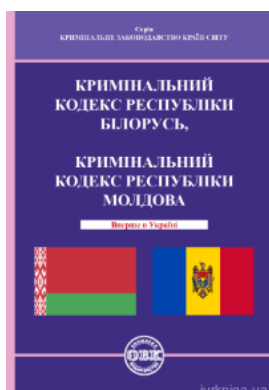
Кримінальний кодекс Республіки Білорусь, Кримінальний кодекс Республіки Молдова