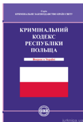
Кримінальний кодекс Республіки Польща