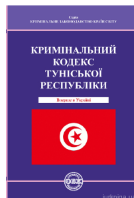
Кримінальний кодекс Туніської Республіки