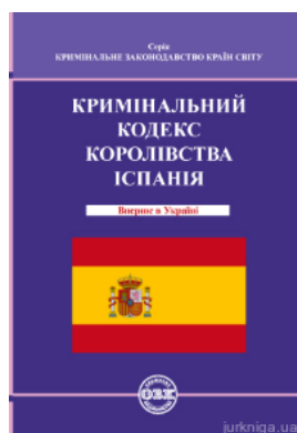
Кримінальний кодекс Королівства Іспанія