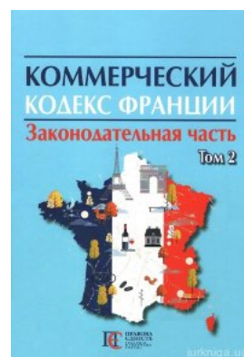
Коммерческий кодекс Франции: в 2-х томах. Том 2

Перейти до галузі права Криминальное право и процесс