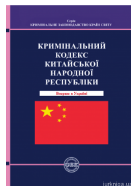
Кримінальний кодекс Китайської Народної Республіки