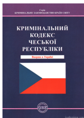
Кримінальний кодекс Чеської Республіки