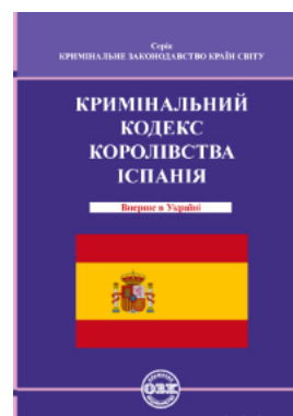
Кримінальний кодекс Королівства Іспанія

Перейти до галузі права Кримінальне право та процес