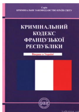
Кримінальний кодекс Французької Республіки