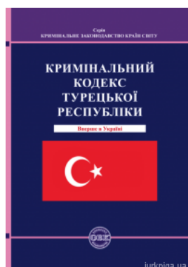
Кримінальний кодекс Турецької Республіки