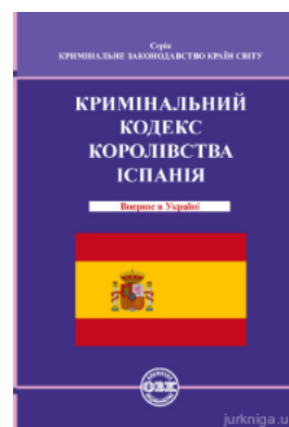
Кримінальний кодекс Королівства Іспанія