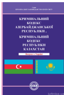
Кримінальний кодекс Азербайджанської Республіки, Кримінальний кодекс Республіки Казахстан