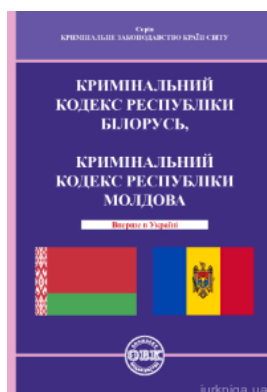
Кримінальний кодекс Республіки Білорусь, Кримінальний кодекс Республіки Молдова