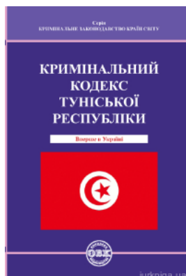
Кримінальний кодекс Туніської Республіки