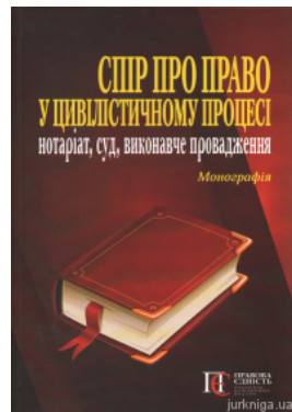
Спір про право у цивілістичному процесі: нотаріат, суд, виконавче провадження