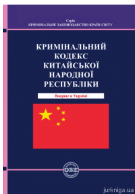
Кримінальний кодекс Китайської Народної Республіки