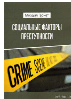
Социальные факторы преступности

Перейти до галузі права Криминальное право и процесс