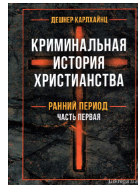
Криминальная история христианства в 2-х книгах. Ранний период и поздняя античность