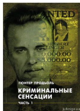
Криминальные сенсации. В двух частях