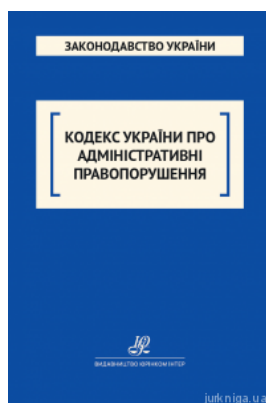
Кодекс України про адміністративні правопорушення. Юрінком Інтер