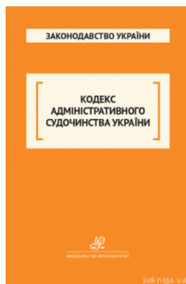
Кодекс адміністративного судочинства України. Юрінком Інтер