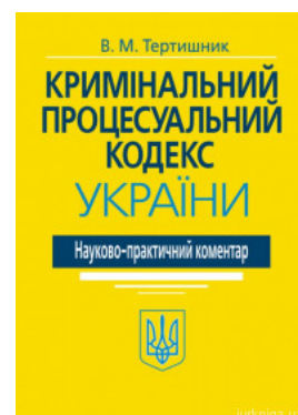
Науково-практичний коментар Кримінального процесуального кодексу України. Видання 20-те