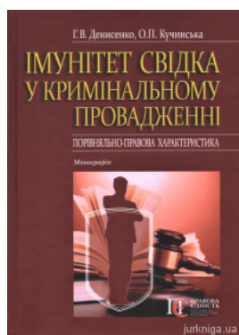
Імунітет свідка у кримінальному провадженні (порівняльно-правова характеристика)