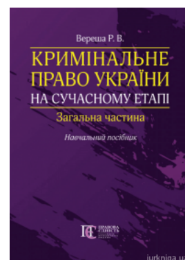
Кримінальне право України на сучасному етапі. Загальна частина

Перейти до галузі права Кримінальне право та процес