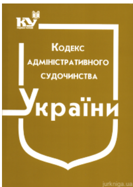
Кодекс адміністративного судочинства України