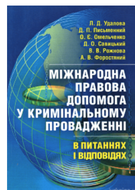
Міжнародна правова допомога у кримінальному провадженні в питаннях та відповідях