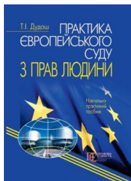
Практика Європейського суду з прав людини