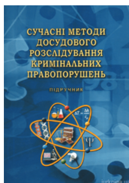
Сучасні методи досудового розслідування кримінальних правопорушень