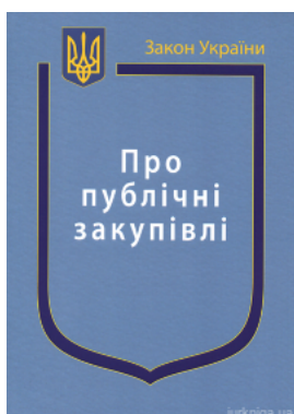
Закон України "Про публічні закупівлі"