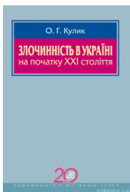
Злочинність в Україні на початку XXI століття