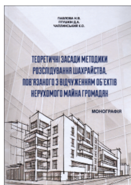
Теоретичні засади методики розслідування шахрайства, пов'язаного з відчуженням об'єктів нерухомого майна громадян