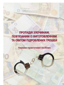
Протидія злочинам, пов'язаним із виготовленням та обігом підроблених грошей