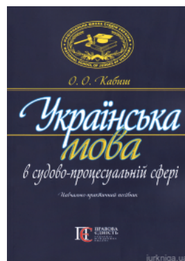
Українська мова в судово-процесуальній сфері. Навчально-практичний посібник. Видання друге