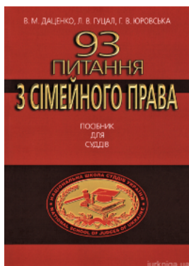
93 питання з сімейного права. Посібник для суддів