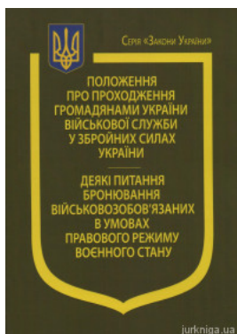
Указ Президента України "Про положення про проходження громадянами України військової служби у Збройних Силах України", Постанова...