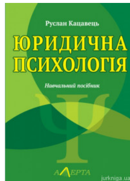
Юридична психологія. Навчальний посібник