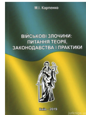
Військові злочини: питання теорії, законодавства і практики

Перейти до галузі права Кримінальне право та процес