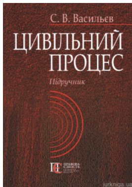
Цивільний процес. Підручник