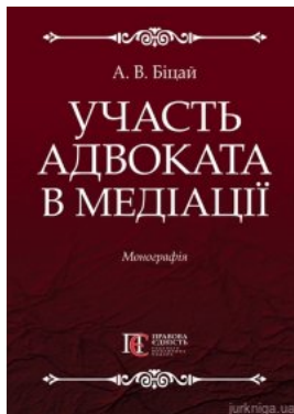
Участь адвоката в медіації