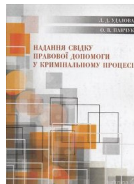
Надання свідку правової допомоги у кримінальному процесі