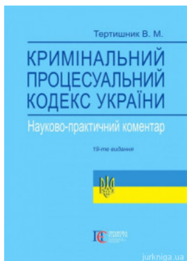
Науково-практичний коментар Кримінального процесуального кодексу України. Видання 19-те