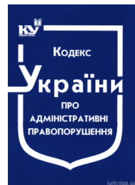
Кодекс України про адміністративні правопорушення

Перейти до галузі права Кримінальне право та процес