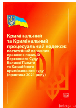
Кримінальний та Кримінальний процесуальний кодекси: постатейний показчик правових позицій Верховного Суду - Великої Палати та Касаційного...