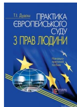
Практика Європейського суду з прав людини

Перейти до галузі права Кримінальне право та процес