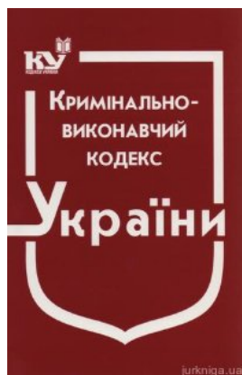
Кримінально-виконавчий кодекс України