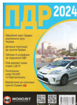
Правила дорожнього руху України 2024