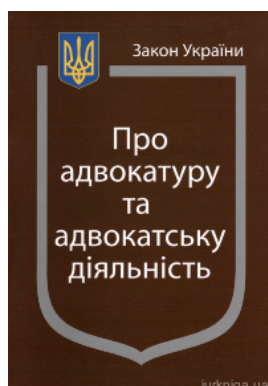
Закон України "Про адвокатуру та адвокатську діяльність"