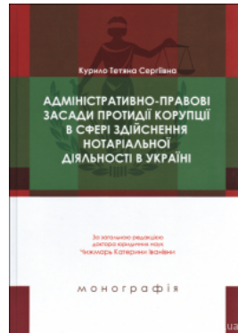
Адміністративно-право ві засади протидії корупції в сфері здійснення нотаріальної діяльності в Україні