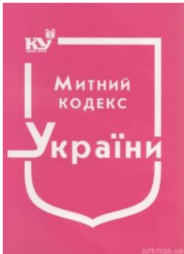
Митний кодекс України