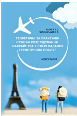
Теоретичні та практичні основи розслідування шахрайства у сфері надання туристичних послуг