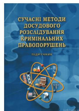
Сучасні методи досудового розслідування кримінальних правопорушень

Перейти до галузі права Кримінальне право та процес