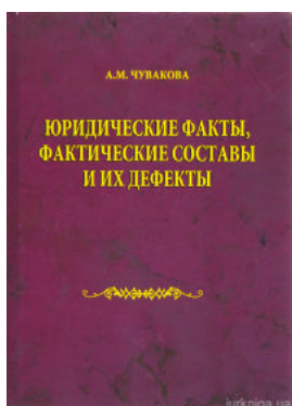
Юридические факты, фактические составы и их дефекты