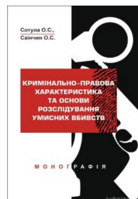
Кримінально-правова характеристика та основи розслідування умисних вбивств

Перейти до галузі права Кримінальное право и процесс