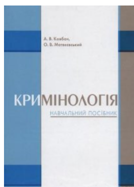
Кримінологія. Навчальний посібник