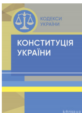
Конституція України. ЦУЛ

Перейти до галузі права Філософія та психологія права