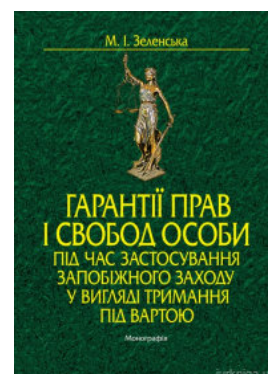
Гарантії прав і свобод особи під час застосування запобіжного заходу у вигляді тримання під вартою