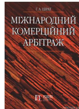
Міжнародний комерційний арбітраж