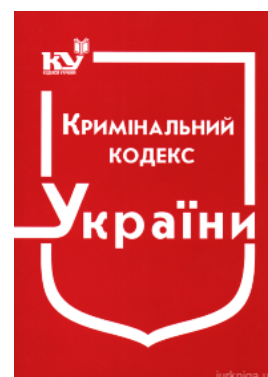
Кримінальний кодекс України