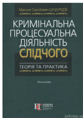
Кримінальна процесуальна діяльність слідчого: теорія та практика