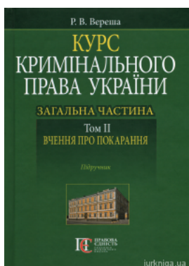
Курс кримінального права України. Загальна частина. Том 2: вчення про покарання