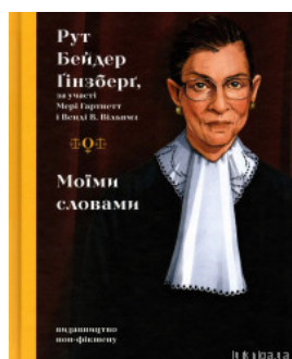
Моїми словами: біографія

Перейти до галузі права Кримінальне право та процес