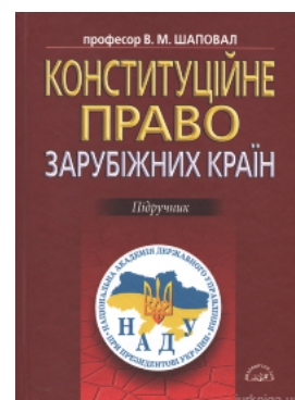
Конституційне право зарубіжних країн. Підручник