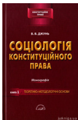
Соціологія конституційного права. Книга перша. Теоретико-методологічні основи