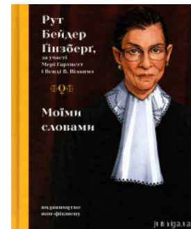
Моїми словами: біографія

Перейти до галузі права Кримінальне право та процес