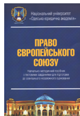
Право Європейського Союзу. Навчально-методичний посібник з тестовими завданнями для підготовки ЗНО