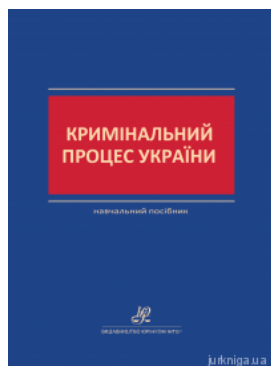
Кримінальний процес України. Навчальний посібник