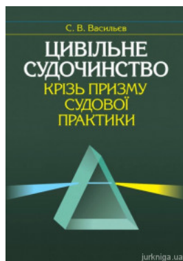
Цивільне судочинство крізь призму судової практики