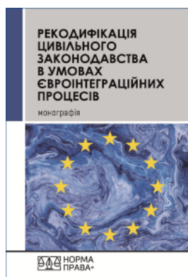
Рекодифікація цивільного законодавства України в умовах євроінтеграційних процесів