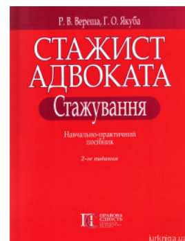
Стажист адвоката. Стажування. Навчально-практичний посібник. Видання друге