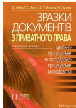
Зразки документів з приватного права (цивільне, сімейне, житлове, трудове, земельне, цивільно-процесуальне та госпо-дарсько--процес уальне...