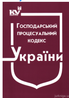
Господарський процесуальний кодекс України