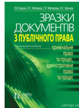
Зразки документів з публічного права (кримінальне право та процес, адміністративне право та процес)