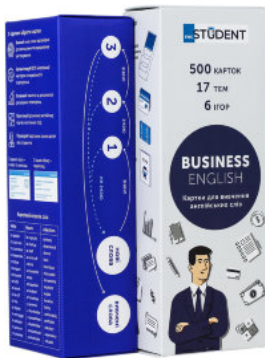
Business English. Картки для вивчення англійських слів