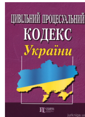
Цивільний процесуальний кодекс України. Алерта

Перейти до галузі права Иностранный язык для юристов