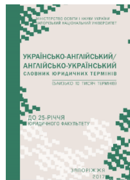
Українсько-англійський / англійсько-український словник юридичних термінів: близько 10 тис. термінів

Перейти до галузі права Іноземна мова для юристів