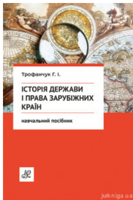
Історія держави і права зарубіжних країн