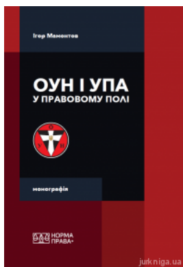
ОУН і УПА у правовому полі

Перейти до галузі права Історія держави та права