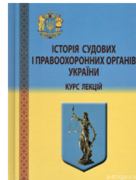
Історія судових і правоохоронних органів України. Курс лекцій