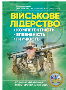
Військове лідерство: компетентність, впевненість, гнучкість. Універсальний навчальний посібник для рейнджерів