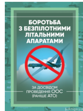
Боротьба з безпілотними літальними апаратами (за досвідом проведення ООС (раніше АТО))