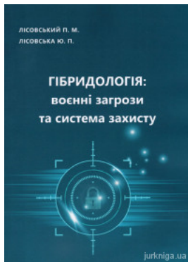
Гібридологія: воєнні загрози та система захисту