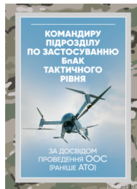
Командиру підрозділу по застосуванню БпАК тактичного рівня (за досвідом проведення ООС (раніше АТО))