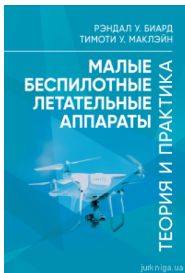
Малые беспилотные летательные аппараты: теория и практика