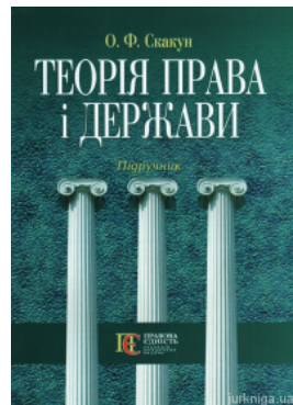
Теорія права і держави. Підручник, 4-те видання