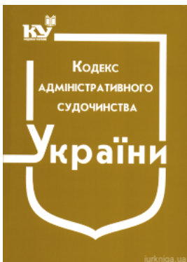
Кодекс адміністративного судочинства України