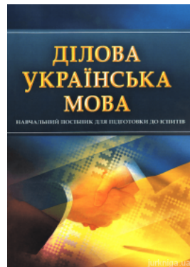
Ділова українська мова. Навчальний посібник для підготовки до іспитів