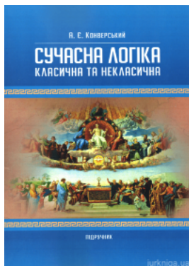
Сучасна логіка (класична та неklasична)