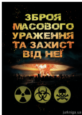
Зброя масового ураження та захист від неї. Навчальний посібник