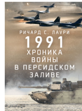
1991. Хроніка війни в Персидському заливі