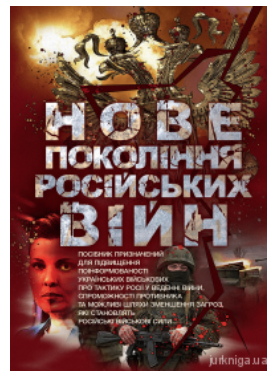
Нове покоління російських війн