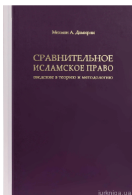
Сравнительное исламское право: введение в теорию и методологию