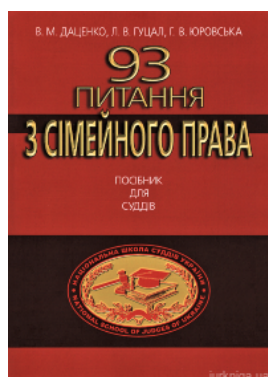
93 питання з сімейного права. Посібник для суддів