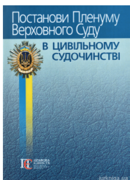
Постанови Пленуму Верховного Суду в цивільному судочинстві