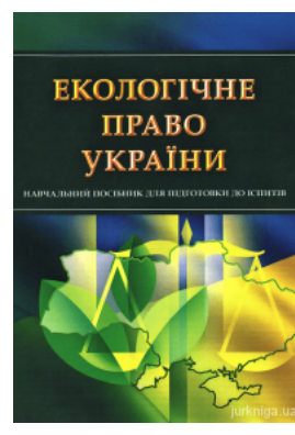
Екологічне право України. Навчальний посібник для підготовки до іспитів

Перейти до галузі права Гражданское право и процесс