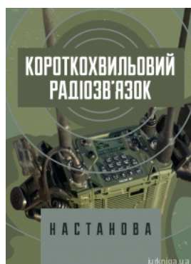
Короткохвильовий радіозв'язок. Настанова