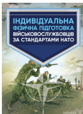
Індивідуальна фізична підготовка військовослужбовців за стандартами НАТО